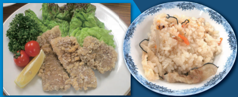
くじら竜田揚げとくじら飯