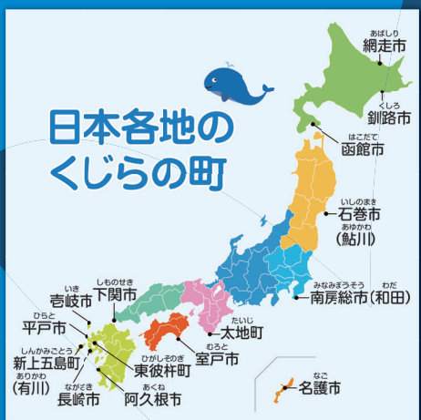
くじらの町の紹介コーナーのバネル

※「くじら料理」のふるまいは、10月31日までに右記QRコードからお申込みください。