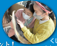
くじらのヒゲに さわるこどもたち